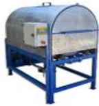
Desactivadora de Soya