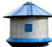
Silo de Concentrado