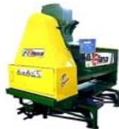
Elaboración de Concentrado