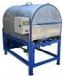
Desactivado de Soya