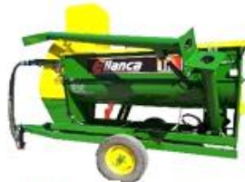
Elaboración de Concentrado Móvil